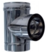
ag T 90° avec bouchon poêle à pellets double paroi inox 80/130 €145,00

Coude poêle à pellets 45° double paroi isolé inox 80/130 [Détails du produit...]