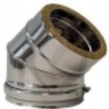
ae Coude poêle à pellets 45° double paroi isolé inox 80/130 €45,00

Adaptateur pour passer du simple paroi au double paroi [Détails du produit...]