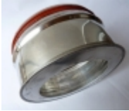
Adaptateur simple paroi au double paroi diam.120 €30,00

Adaptateur pour passer du simple paroi au double paroi [Détails du produit...]